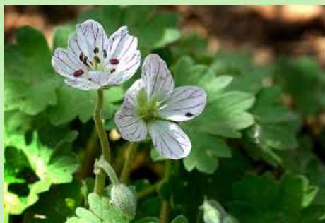
Geranio de Cazorla ( Geranium cazorlense )

Especie relíctica que cuenta con menos de 750 individuos, en una sola población que ocupa un área de 0,5 km 2 , con un hábitat muy específico afectado por los herbívoros y ciertas actividades turísticas. Está protegida sólo a nivel regional