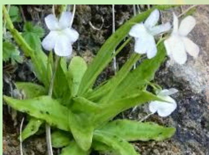
Grasilla ( Pinguicula jallisneriifolia )

Es una de las especies de flora más significativas y singulares del territorio del Parque Natural de la Sierra de Cazorla, Segura y las Villas. Se puede localizar en zonas umbrías y destaca por su color violáceo intenso.