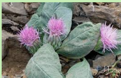
Rizomatosa ( Jurinea de fontqeri )

Es una de las especies de flora más significativas y singulares del territorio del Parque Natural de la Sierra de Cazorla, Segura y las Villas. Se puede localizar en zonas umbrías y destaca por su color violáceo intenso.