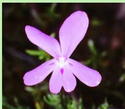
Violeta de Cazorla ( Viola cazorlensis )

Esta planta es carnívora Se encuentra en roquedos y travertinos calcáreos rezumantes. Se encuentra a una altitud entre 600 y 1700 metros